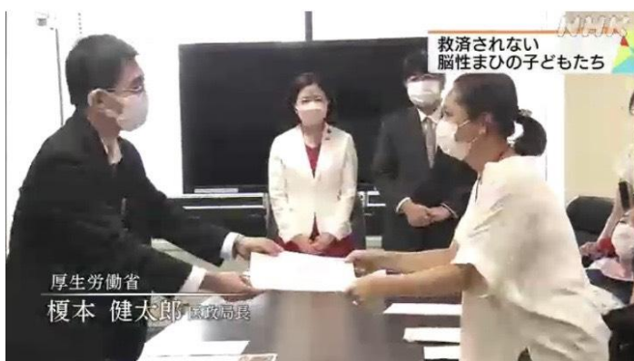
2022年8月5日 要請書提出

●11月10日議員連盟にて弊会の要望が取り上げられ、当事者達が直接国会議員の前で話をさせて頂きました！！