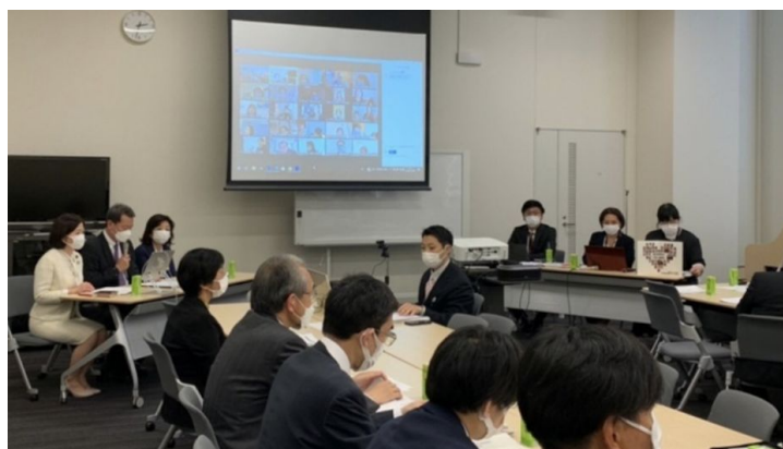
2022年11月10日 成育基本法推進議員連盟